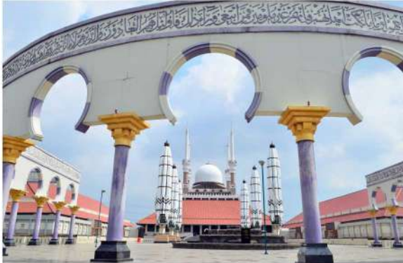
Masjid Agung Jawa Tengah

arsitektural campuran Jawa, Islam dan Yunani. Bangunan utama masjid beratap limas dengan kubah besar, 4 menara pada tiap penjurunya dan satu menara setinggi 99 meter, yang disebut dengan menara Asmaul Husna. Di dalam menara terdapat Museum Perkembangan Islam di Jawa Tengah.