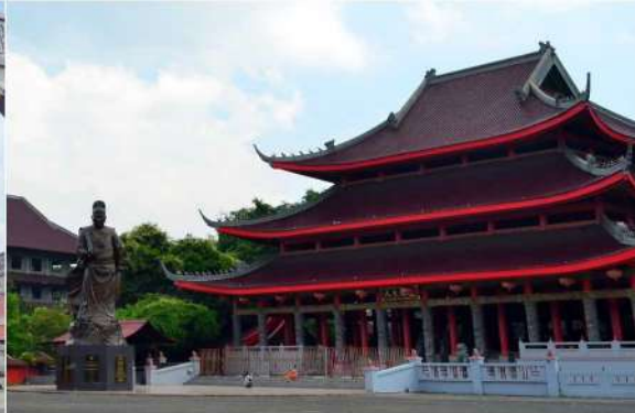
Klenteng Sam Poo Kong

Klenteng Sam Poo Kong dibangun oleh orang